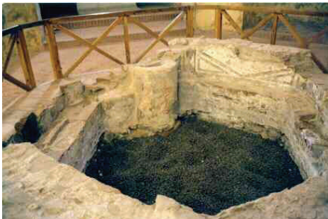
Battistero S. Giovanni ad Fontes V sec.