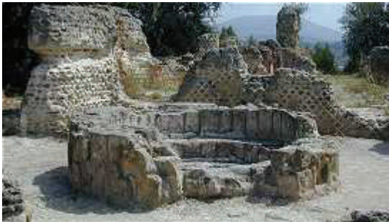
Battistero di Cuma