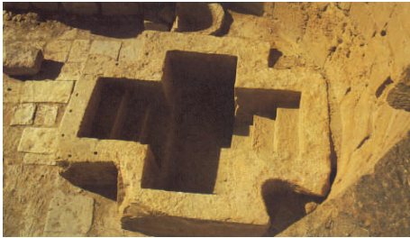
Battistero cruciforme mediorientale